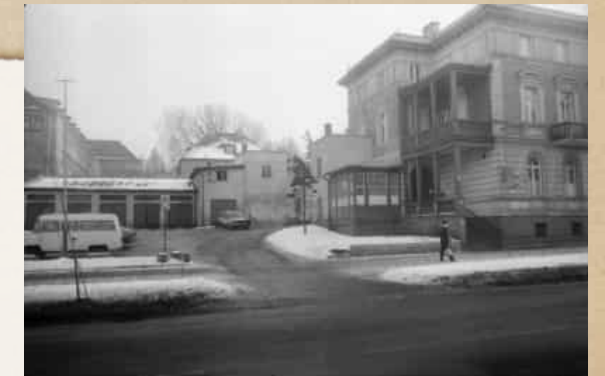
Fot. Kwiatkowski Robert, 1991, Jelenia Góra